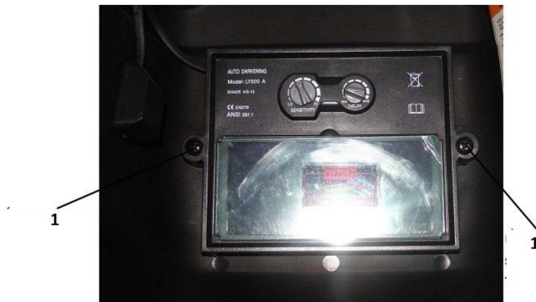
1. Upevňovacia skrutka rámu filtra